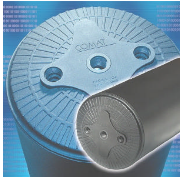
DExWin ® Druckbehälter DExWin ® Pressure Vessel

Hannover Fair from April 7 th - 12 th was successful for COMAT. Again, COMAT took part at the fair together with ADETE GmbH, a partner of 'Plastic-Network Rhineland-Palatinate'.