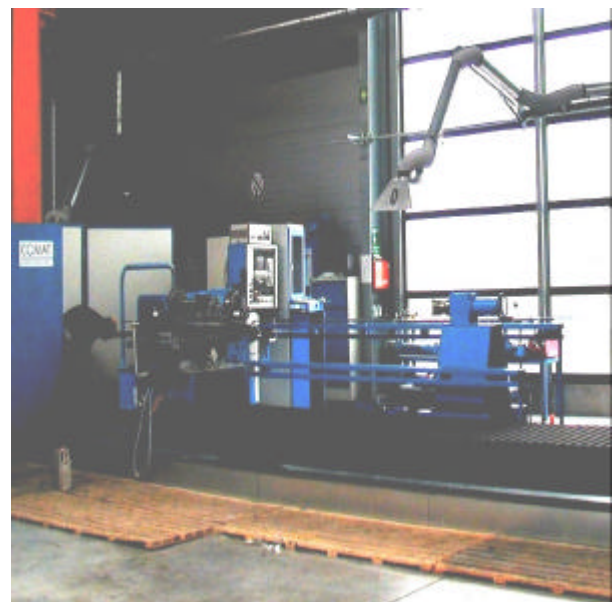
CNC gesteuerte Wickelmaschine CNC controlled winding machine

The winding machine was extended from 4,5 up to 15 meters last month. Furthermore, an extension of the oven from 11 to 15 meters is planned. Thus, one of the longest winding machines is available to our customers.