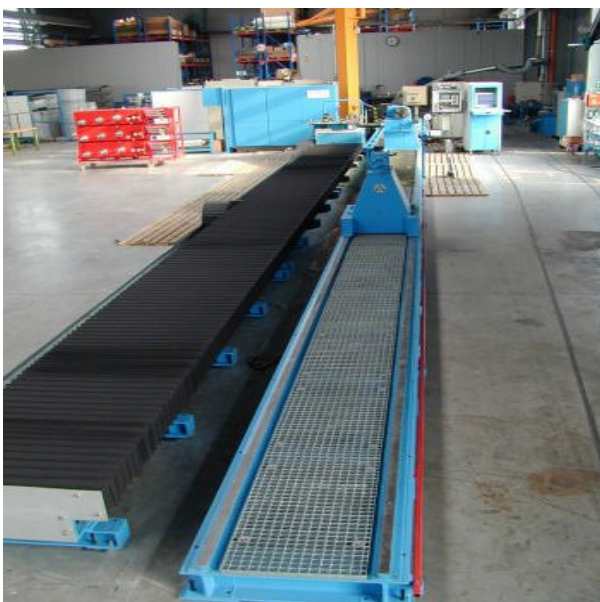
Verlängerte Wickelmaschine Extended winding machine

Die Wickelmaschine wurde im letzten Monat von 4,5 auf 15 Meter verlängert. Zudem ist eine Verlängerung des Ofens von 11 auf 16 Meter geplant. Hiermit steht unseren Kunden eine der längsten Wickelmaschinen zur Verfügung.