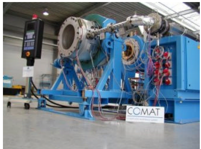
Installation des Extruderkopfes Extruder Tools being installed