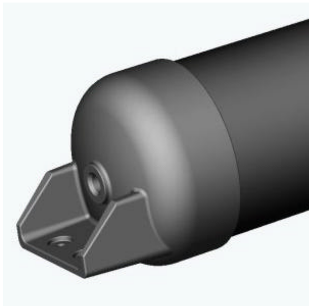
Detailansicht des DExWin® Druckspeichers Detail view of DExWin® pressure vessel