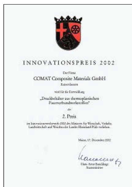
Innovation Reward 2002