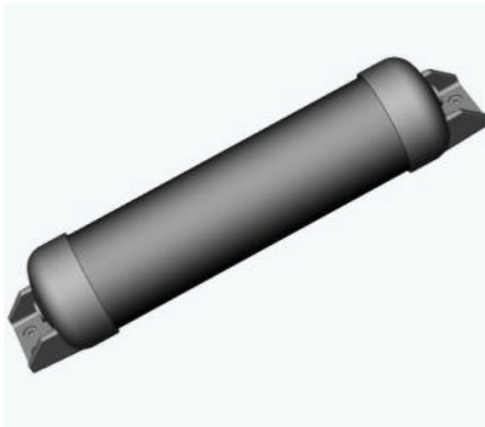
DExWin® Druckspeicher für Pkws DExWin® Pressure vessel for Automobiles